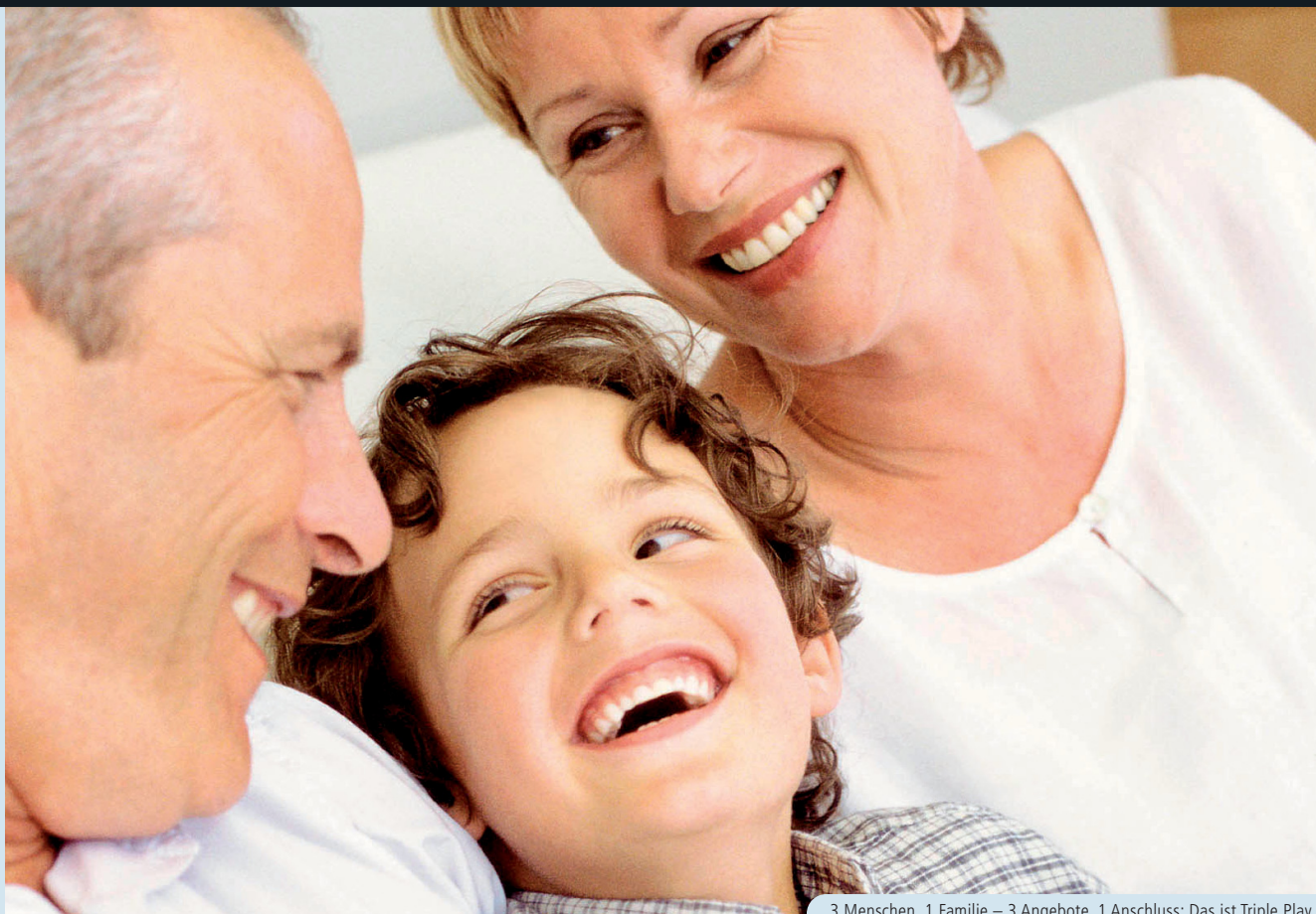
3 Menschen, 1 Familie – 3 Angebote, 1 Anschluss: Das ist Triple Play.